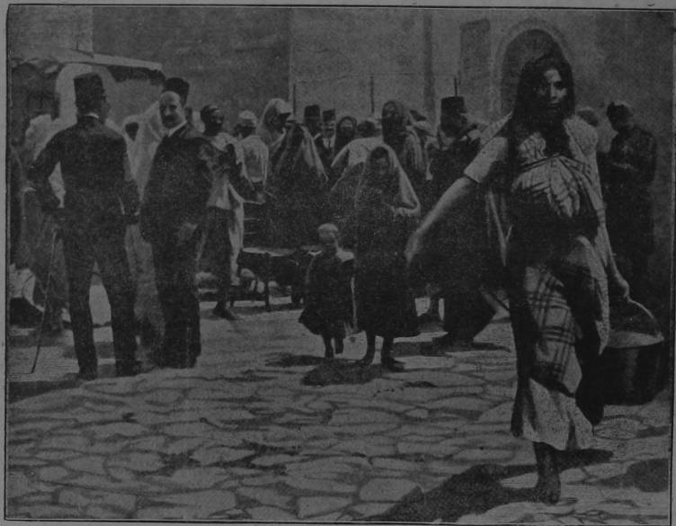
Escena en una plaza de Trípoli

Los cañones italianos han despertado la poética y blanca ciudad que dormía entre el oasis y el mar