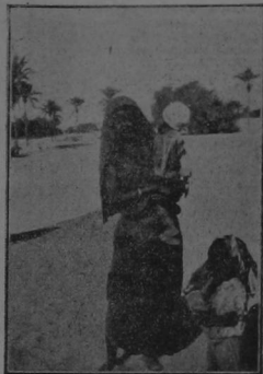
Una beduina de los alrededores de Trípoli

Los cañones Italianos han vomitado acero contra Trípoli, la ciudad africana que fortificó Carlos V; sobre las aguas procelosas de la Gran Siria, se mecen los dracodouchts de Italia que exigen la rendición y amenazan con la muerte.