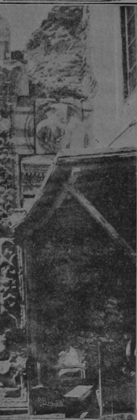
El arco omano de Marco Aurelio en Trípoli

ta, pequeña y blanca, de corte misterioso, cerrada á los profanos y á los curiosos.